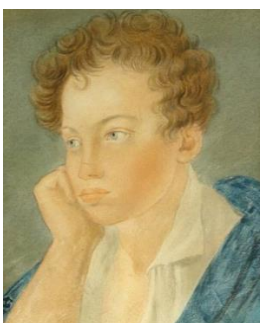
Художник С. Чириков

К счастью, у отца было много книг, которые вскоре стали его «друзьями». За несколько лет он перечитал почти всю библиотеку отца. Еще не умея писать, маленький Пушкин начал сочинять стихи. Лежа в постели, он складывал собственные строки и раз за разом повторял их, чтоб запомнить и потом, когда он выучится писать, перенести эти строки в тетрадь. Позже, уже научившись читать и писать, Пушкин сочинял, кроме стихов, и басни, и героические поэмы.