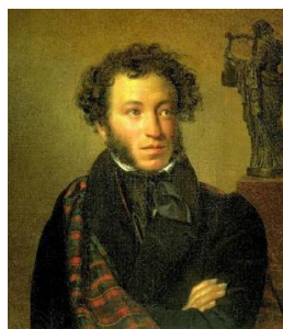
Художник О. Кипренский

Писатель Валерий Воскобойников придумал детскую серию книг - «Жизнь замечательных детей» («ЖЗД»). Эта серия была удостоена Почетного Международного диплома им. Г. Х. Андерсена. В книгах серии рассказывается о детских годах великих людей России и других стран: об Александре Невском, о царе Петре I, о великих поэтах А. С. Пушкине и М. Ю. Лермонтове, а также о многих других известных людям.