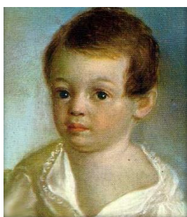
Художник К. Де-Местр

Следующий рассказ посвящен детским годам великого русского поэта Александра Сергеевича Пушкина.