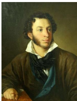
Художник В. Тропинин

Александр Сергеевич к шестнадцати годам превратился в юношу, стихи которого с удовольствием читал весь образованный Петербург. Учась в Царскосельском Лицее, он заслужил одобрение таких поэтов, как Василий Андреевич Жуковский и Гавриил Романович Державин.