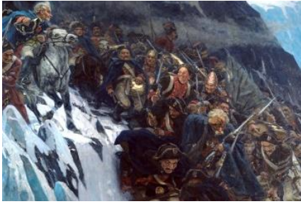
Картина В. Сурикова «Переход Суворова через Альпы»