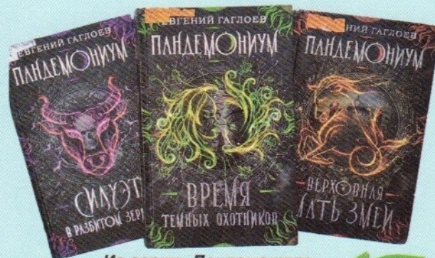
Из серии «Пандемониум»