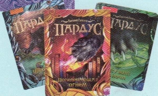
Из серии «Пардус»