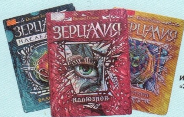
Из серии «Зерцалия»