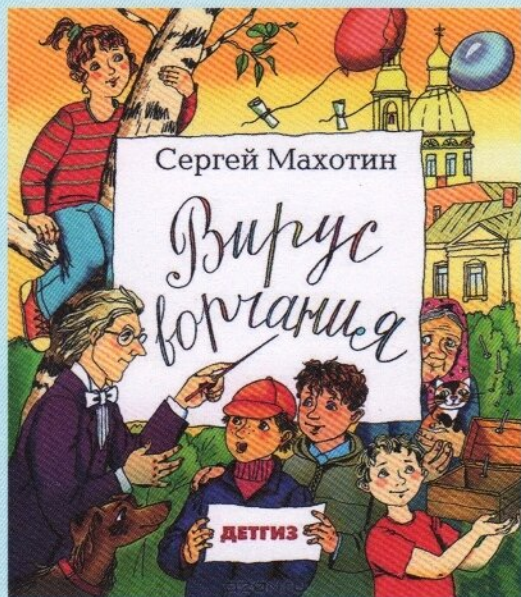
За книгу «Вирус ворчания» автор удостоен Почётного диплома Международного совета по детской и юношеской книге

Сейчас писатель живёт и работает в Санкт-Петербурге.