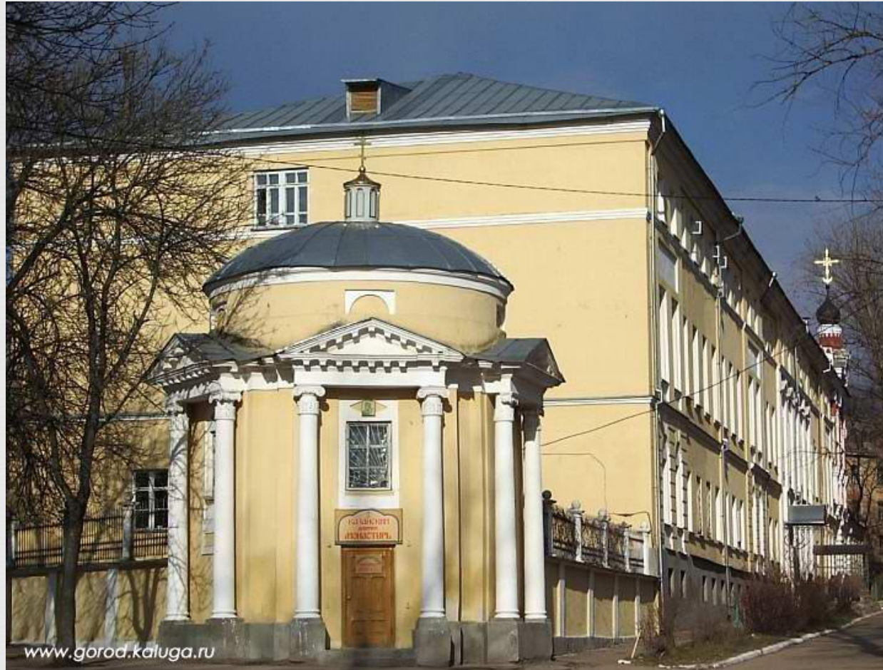
Родовое гнездо купцов Билибиных (ул. Театральная, д. 33/13)