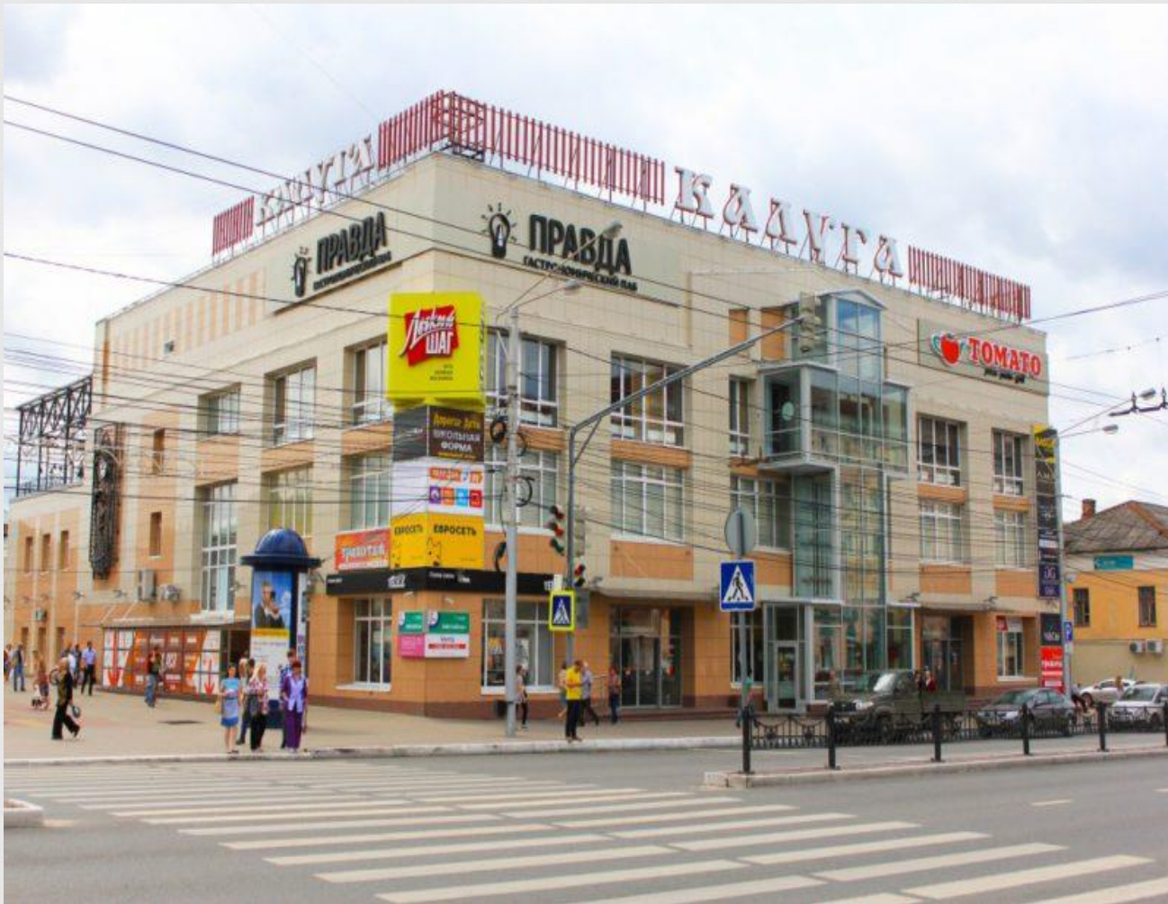
Современный вид универсама «Калуга»