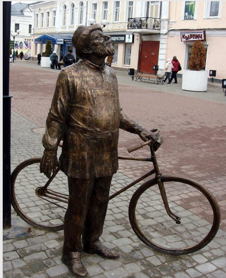
Скульптура «Грёзы о небе». Циолковский. (8 апреля 2011 года). Автор скульптуры – Светлана Фарнеева