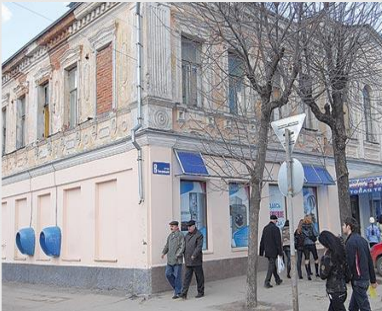
Бывший дом с магазином купцов Сафроновых (ул. Театральная, 8)