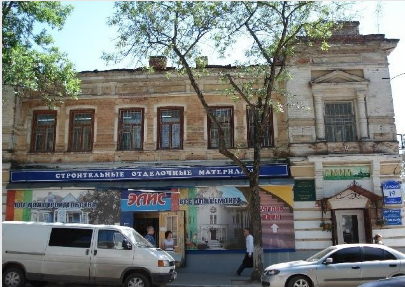
Ул. Театральная, д.19