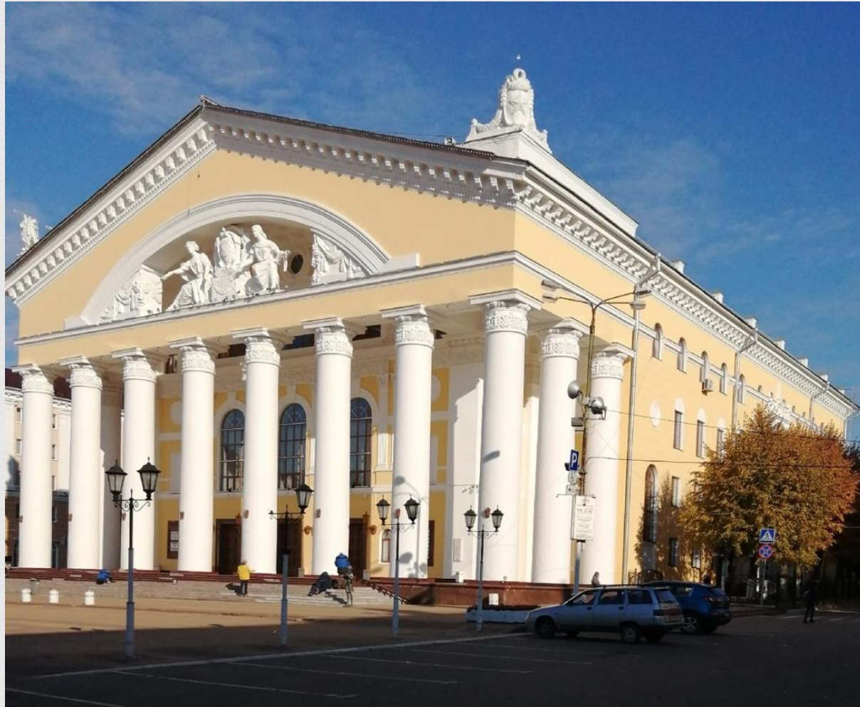
Калужский ордена Трудового Красного Знамени областной драматический театр