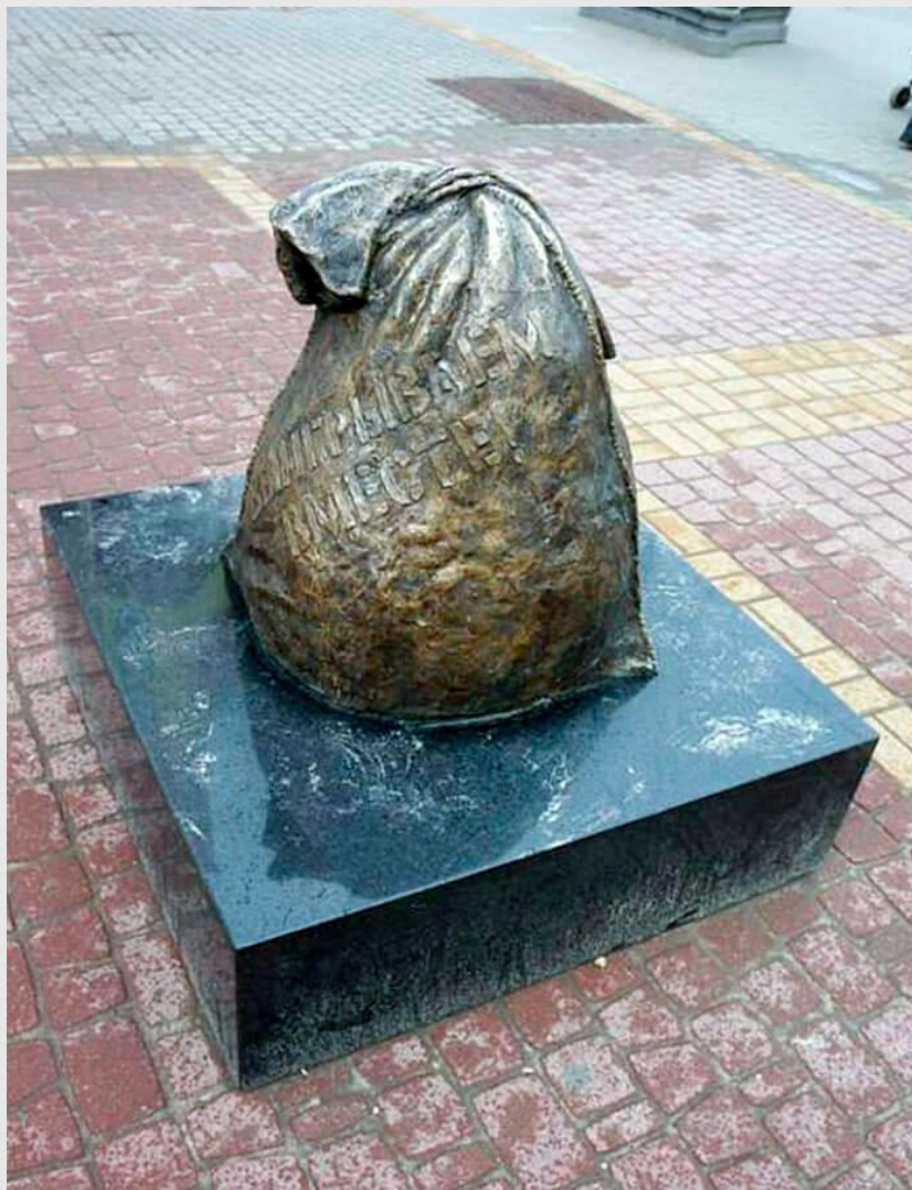
Скульптура под названием «Удача»