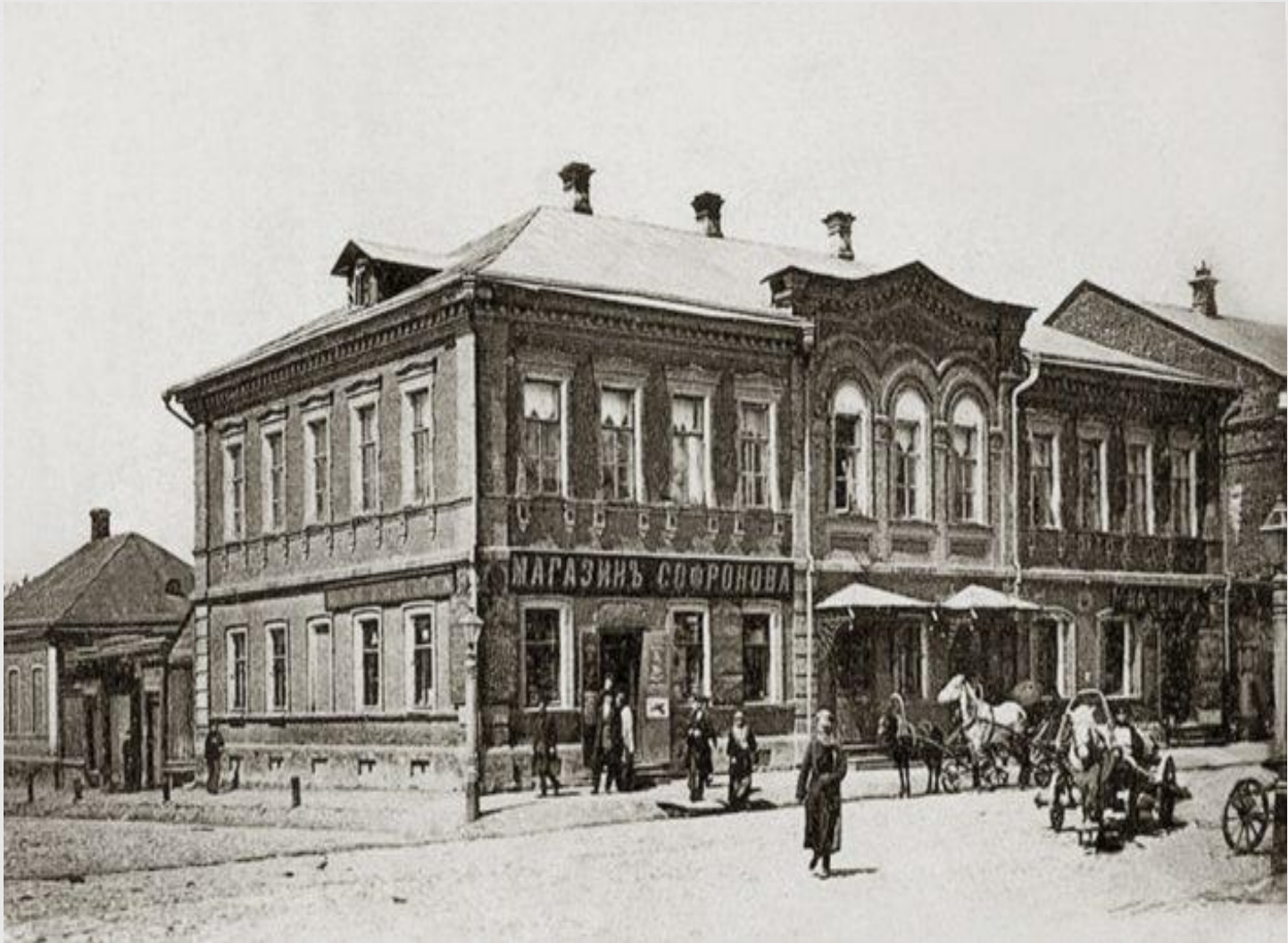
Дореволюционное фото магазина Сафронова