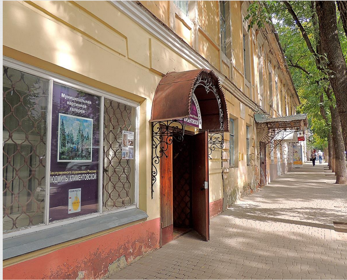
Картинная галерея Л. Климентовской (ул. Театральная, 30)