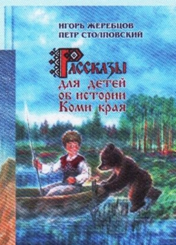
Увлекательные «Рассказы для детей об истории Коми края» изданы на русском и коми языках