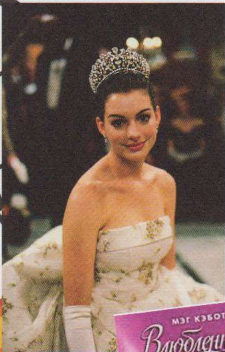
Кадр из фильма о Мии Термополис

Мэг – автор более 50 разносюжетных романов и очень гордится письмами своих читателей, благодарящих её за то, что она помогла им преодолеть нелюбовь к чтению.