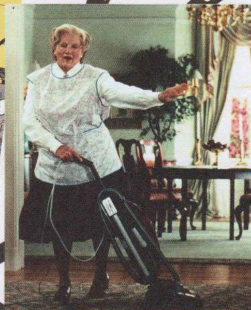
Кадр из фильма «Миссис Даутфайр» (режис. Крис Коламбус)